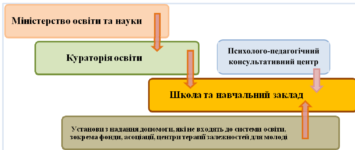
Діаграма 3. Структура формальних та допоміжних впливів на школи та навчальні заклади

Психолого-педагогічний консультативний центр (консультативний центр п-п) - це заклад, завданням якого є надання учням психологічної, педагогічної й іншої спеціалізованої допомоги та терапії, таких як логопедія та профорієнтація. В системі освіти функціонують державні та неpubлічні (платні) консультативні центри п-п, а фахівці, які працюють у них (психолог, педагог, психотерапевт, логопед тощо) проводять діагностику, наприклад, визначають інтелектуальні й освітні здібності учнів, сильні та слабкі сторони учня і вказують, яку допомогу/терапію він повинен отримувати в школі - в цьому випадку вони готують висновок. Якщо дитина потребує спеціального навчання (через значний емоційний, інтелектуальний, соціальний дефіцит), учень отримує висновок про спеціальну освіту, а батьки вирішують, в якій школі/навчальному закладі дитина буде його реалізовувати (спеціальна чи загальноосвітня школа). Консультативні центри п-п також підтримують школи у протидії залежностям, працівники проводять заняття для учнів, батьків та вчителів з питань запобігання ризиковій поведінці, часто навчають вчителів на засіданнях педагогічних рад або консультують учнів із загрозою залежності та їх батьків, направляють їх до спеціалізованих установ, якщо ситуація вказує на необхідність відповідної терапії для дитини.